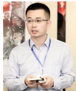
焊接力学及结构设计与制造