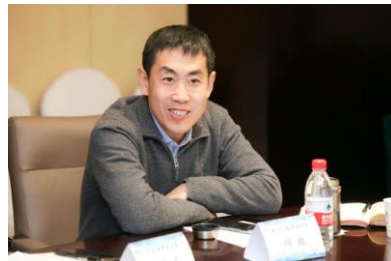
黑龙江省焊接学会