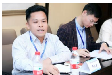
广西壮族自治区焊接学会