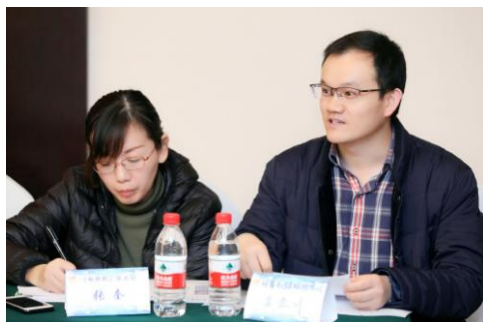
计算机辅助焊接工程