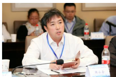
内蒙古自治区焊接学会