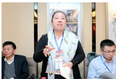
高能束及特种焊接